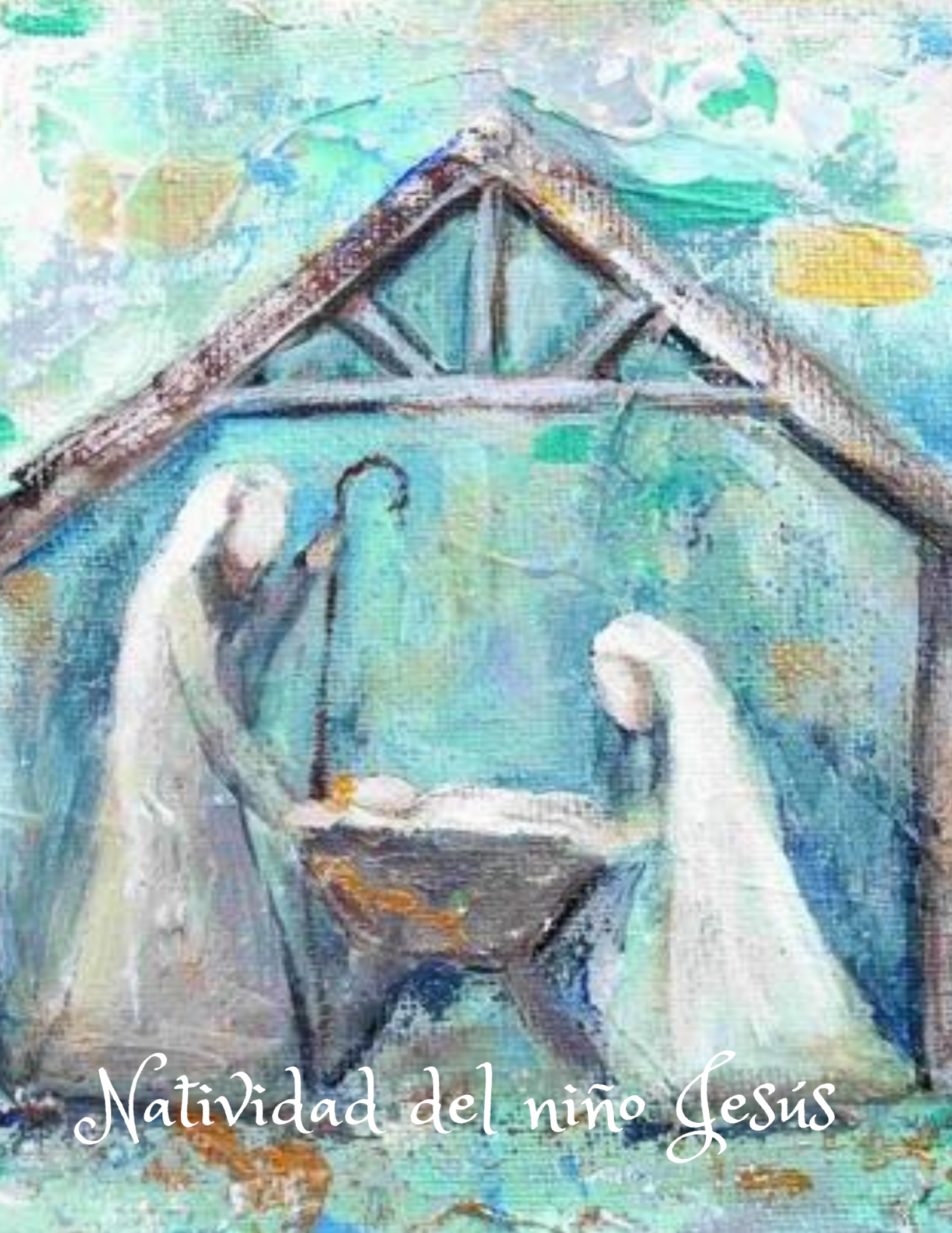
Natividad del niño Jesús